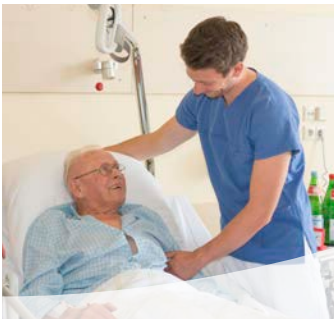
Die Patienten und die Pflege: Ein Team auf dem Weg zur Besserung.